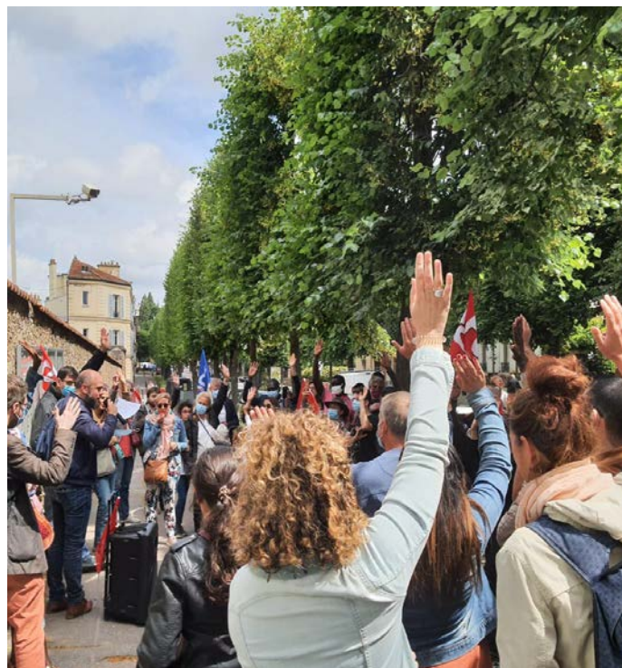
Rassemblement à Versailles pour le réemploi de tous les contractuels

La FNEC FP-FO exige le réemploi et la titularisation de tous les personnels contractuels qui le souhaitent.